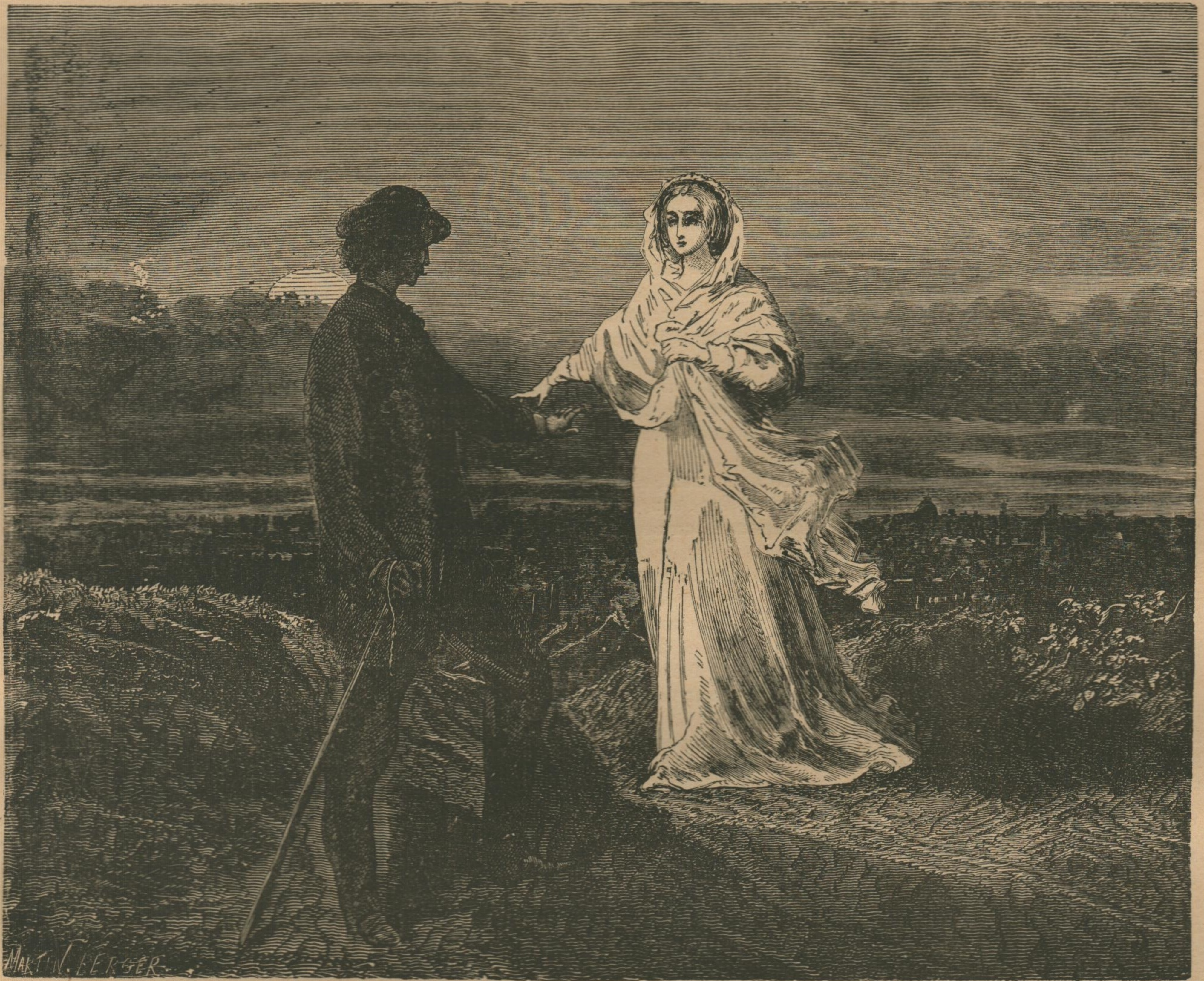
Première apparition de la femme en blanc. (Page 290.)

LA FEMME EN BLANC, par W. WILKIE COLLINS LES PURITAINS DE PARIS, par PAUL BOCAGE SOUVENIRS D'ANTONY, par ALEXANDRE DUMAS